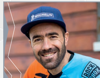
Nicolas Vouilloz Record-wereldkampioen Downhill

Nicolas heeft altijd weer grenzen overschreden, zijn inspiratie zit in hem als icoon. Niet voor niets wordt hij ET genoemd. Recordwereldkampioen, daarna succesvol rallye-rijder en nu een indrukwekkende carrière in het endurosegment. De eMountainbike is voor hem trainingsapparaat en plezierbrenger tegelijk.