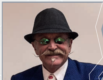
Gary Fisher Mountainbike-legende

Gary Fisher over de fascinatie van eMountainbiken, waarom het mountainbiken in de puurste vorm mogelijk maakt en welke revolutionaire bijdrage de eBike in de toekomst, naar voorbeeld van de VS, hieraan kan leveren.