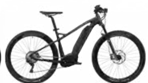
Uproc2 4.10 zwart/grafietgrijs