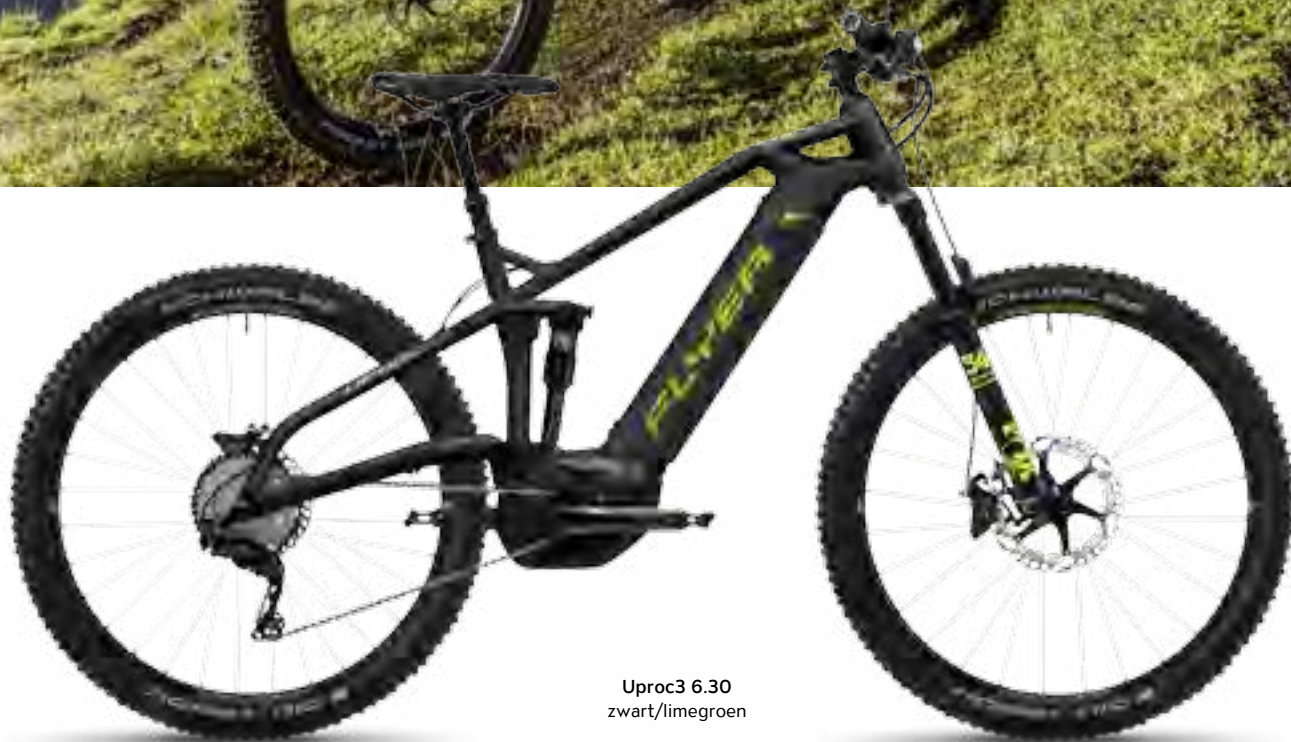
Uproc3 6.30 zwart/limegroen