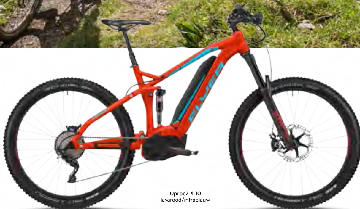
Uproc7 4.10 lavarood/infrablauw