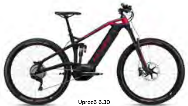
Uproc6 6.30 spaceblauw metallic/ibisrood