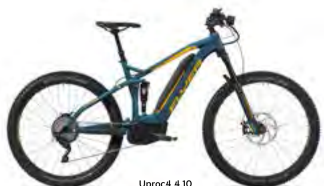
Uproc4 4.10 azuurblauw/goyageel