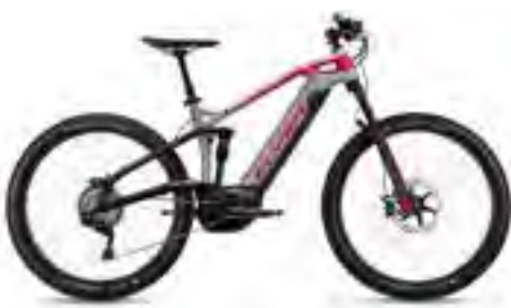
Uproc3 4.10 spacegrijs/arrasrood