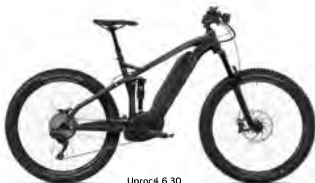
Uproc4 6.30 zwart/grafietgrijs