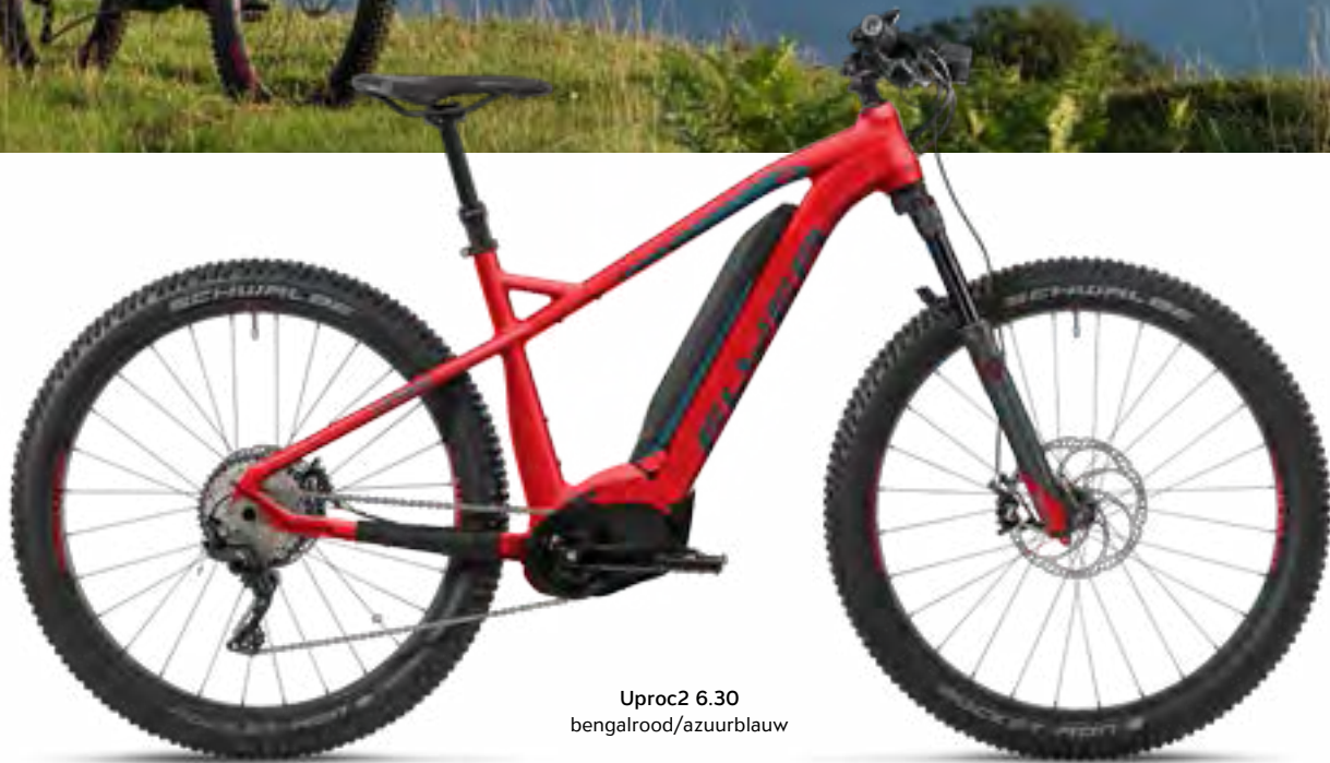
Uproc2 6.30 bengalrood/azuurblauw