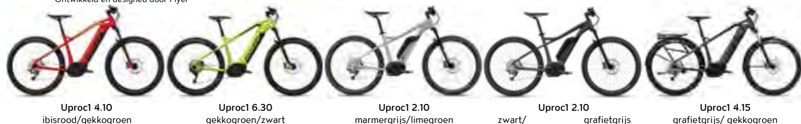
Uproc1 4.10 ibisrood/gekkogroen