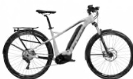
Uproc2 4.15 castsilver/zwart