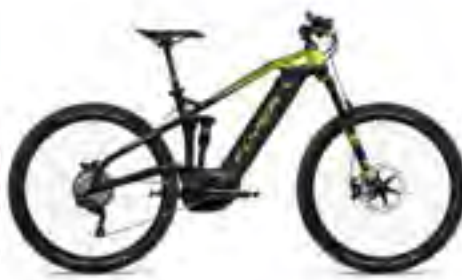
Uproc3 8.70 limegroen/grafietgrijs