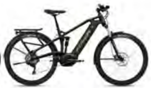
Uproc3 4.15 grafietgrijs/limegroen