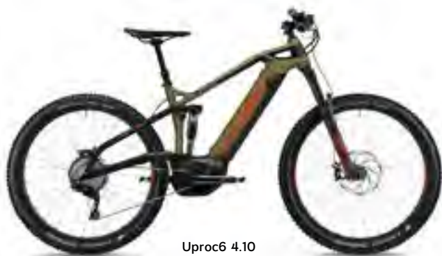
Uproc6 4.10 olijf metallic/magmarood