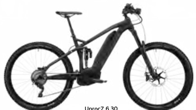
Uproc7 6.30 zwart/grafietgrijs