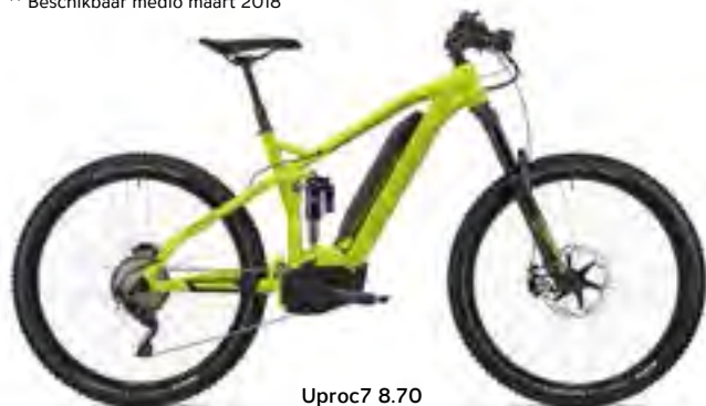
Uproc7 8.70 limegroen/naaldgroen/olijfgroen