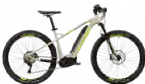
Uproc2 4.10 zandbeige/citroengeel/ijsgroen