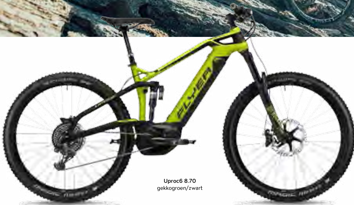
Uproc6 8.70 gekkogroen/zwart