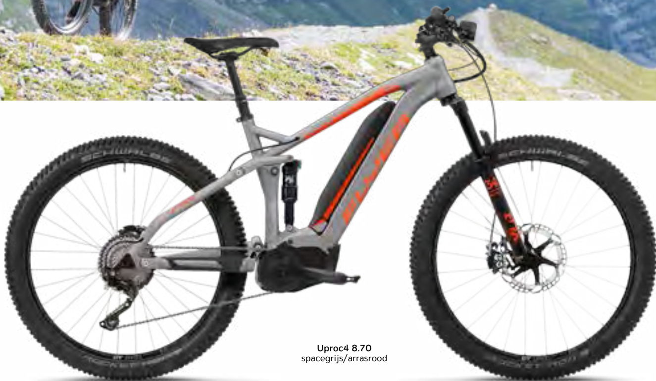
Uproc4 8.70 spacegrijs/arrasrood