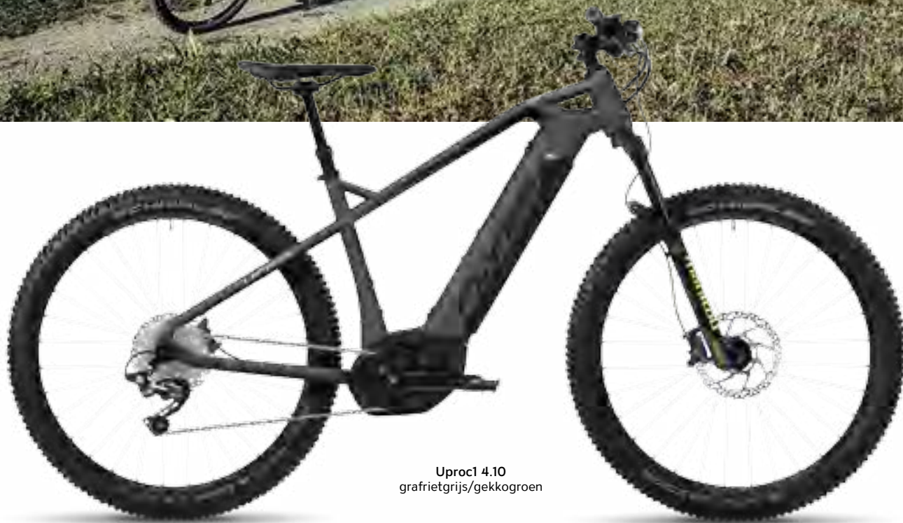
Uprocl 4.10 grafrietgrijs/gekkogroen